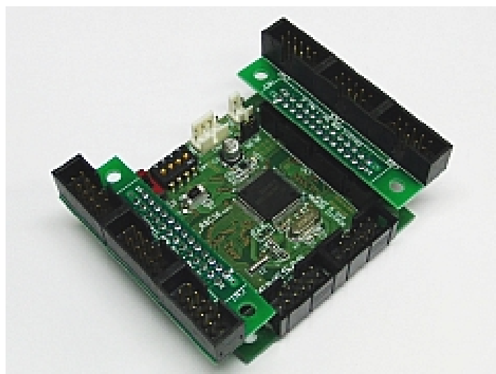
マイコンボード(RY_R8C38ボード) への取り付け例